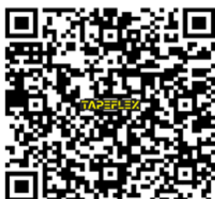
Материал на сайте